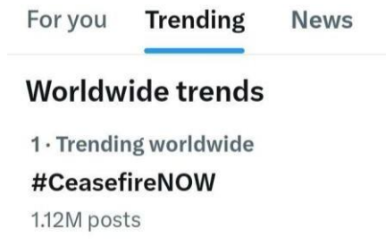
Gambar 1 Trendi Topics

Disamping itu, penggunaan tagar lain, yaitu #CeasefireNow, juga semakin populer akibat kelanjutan serangan Israel yang masif. Tagar ini menjadi sarana bagi warganet untuk menyampaikan seruan gencatan senjata. Pada 8 Oktober 2023, akun @Ahmed_Khaled97 mencatat bahwa #CeasefireNow menjadi tren nomor satu di dunia dengan 1,12 juta unggahan, menunjukkan masifnya solidaritas digital lihat gambar 1. Fenomena ini memperlihatkan bagaimana publik global menggunakan Twitter untuk menyalurkan tuntutan politik minimal yang sederhana namun kuat: "hentikan perang sekarang." Hal ini selaras dengan konsep networked public sphere, di mana konektivitas luas memungkinkan terbentuknya solidaritas transnasional secara cepat.